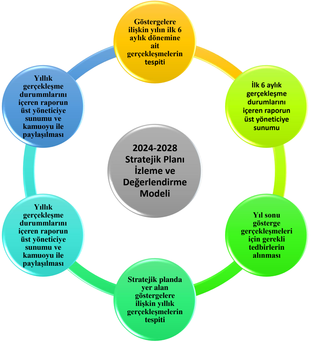
Şekil 2: İzleme ve Değerlendirme Modeli